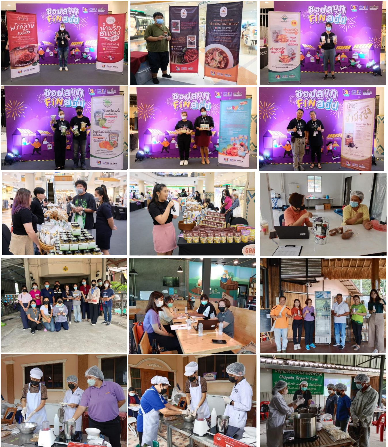
ภาพการดำเนินงานในโครงการ